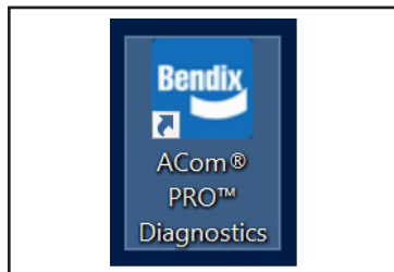
Figura 1 - Icono ACom PRO