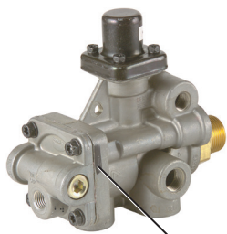
Emplacement du code de date