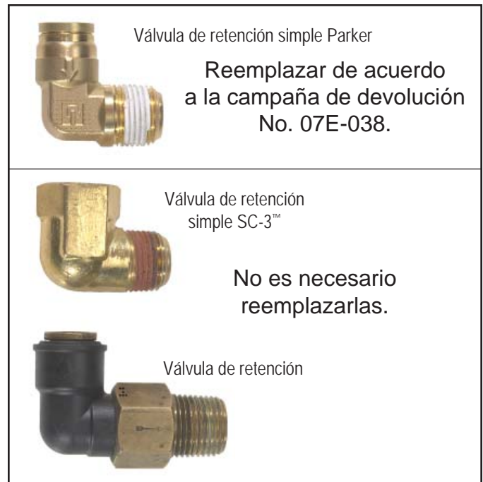
Figura 2 - IDENTIFICACIÓN DE LA VÁLVULA DE RETENCIÓN SIMPLE