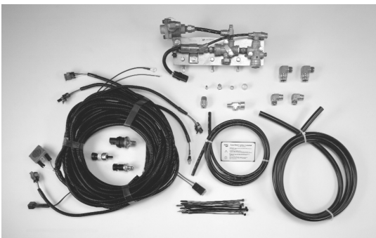
Módulo y juego de instalación de AutoBrake

Las pruebas hechas a los vehículos indican que el AutoBrake no afecta el cumplimiento del vehículo con las regulaciones federales (FMVSS121).