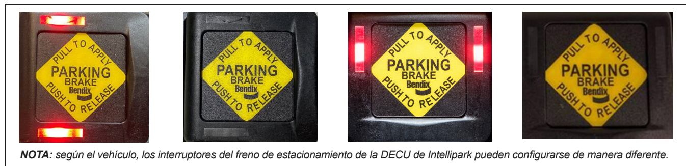
Figura 1 - Interruptor del freno de estacionamiento de la DECU de Intellipark

El conductor debe apagar el motor y ventilar los frenos de servicio para agotar las reservas. La baja presión que provoca esta acción hace que se aplique un freno de resorte para estacionar el vehículo. La falla interna del sistema desaparecerá cuando se apague el motor del vehículo durante al menos 35 segundos y luego se vuelva a encender.